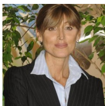
Anna Maria Bernini