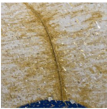
Un'opera di Felice Nittolo