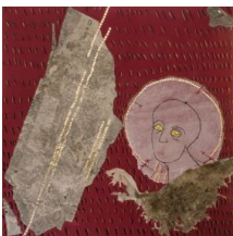
Un'opera di Felice Nittolo