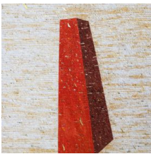
Un'opera di Felice Nittolo