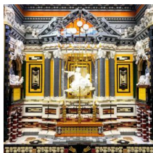
Cappella Cornaro, Chiesa Santa Maria della Vittoria