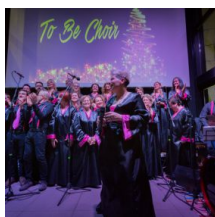
Coro concerto di Natale

Tag: piazza del popolo concerto albero di natale