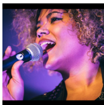
Coro concerto di Natale