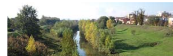
tavola rotonda Fiume Lamone percorso fluviale dall'Appennino al Mare

Ore 9.30 Sala comunale Bigari Piazza del Popolo, 31